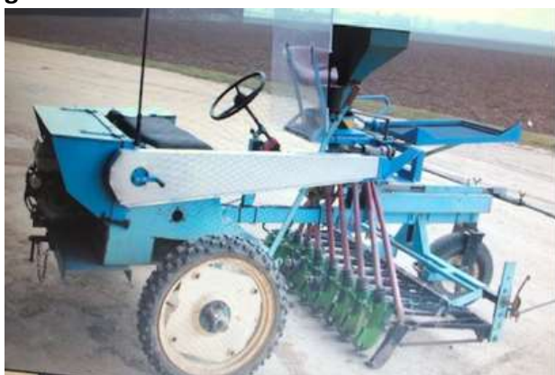
Le blé et le Kernza sont semés avec un semoir très léger.

Les prairies sont semées manuellement à la volée, les semences étant mélangées à du sable de très faible granulométrie.