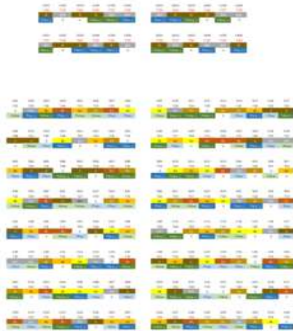
Répartition spatiale aléatoire des traitements en 4 blocs sur une surface totale de 60m par 57 m