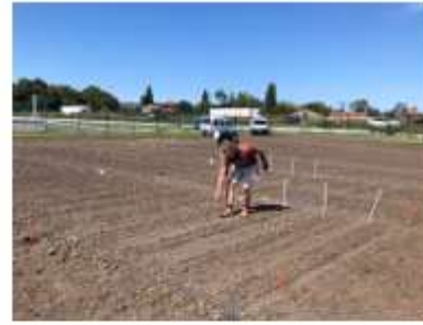
Semis à la main à la volée des prairies