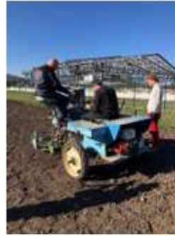
Réglage du semoir