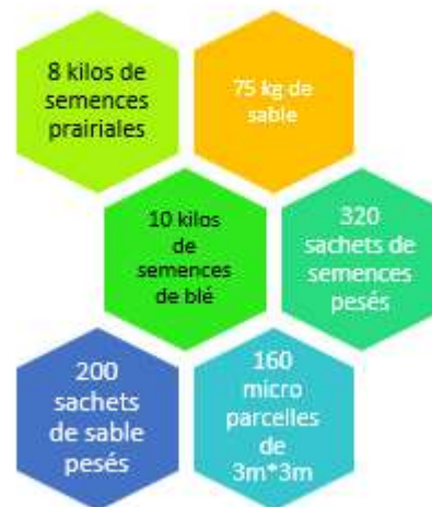
L'implantation automnale de cet essai en chiffres