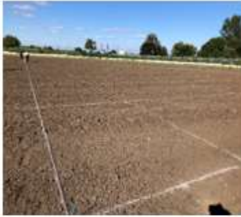
Marquage des futures parcelles